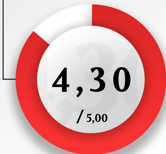
Yhteistyö hoitohenkilökunnan kanssa